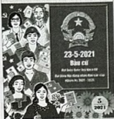
Bìa 1: Chào mừng Ngày bầu cử đại biểu Quốc hội khóa XV và HĐND các cấp nhiệm kỳ 2021-2026.